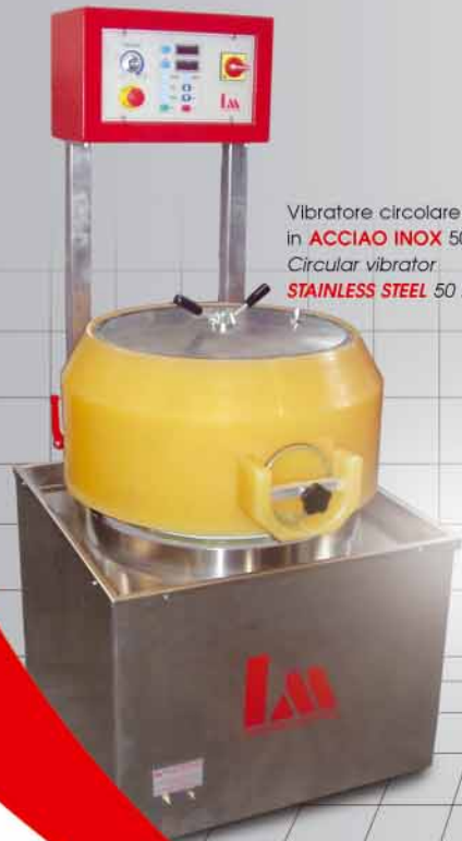
Vibratore circolare in ACCIAIO INOX 50 lt. Circular vibrator STAINLESS STEEL 50 liter

With dip tank made of antiabrasive polyurethane and with the unloading of the materials. By request we can add a variable vibration speed drive for gold, silver, fancy jewellery, optical manufacturing. Available upon requested motor or manual separation sieve.