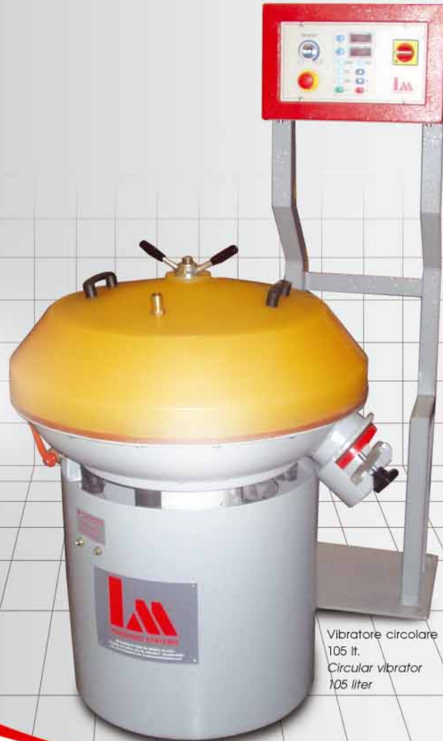
Vibratore circolare 105 lt. Circular vibrator 105 liter