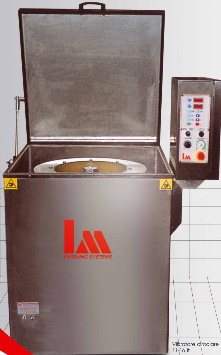
Vibratore circolare XL 11-16 lt. Circular vibrator XL 11-16 liter

Tutte le nostre apparecchiature sono marcate CE. All our equipments are marked CE. Insonorizzato, costruito interamente in acciaio inox, completo di variatore di velocità. LM Finishing Systems, it is possible to make the probable technical modifications without to give warnings.