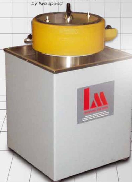
Vibratore circolare da 5-7-11-16 litri con variatore 5-7-11-16 liter circular vibrator with variable speed control