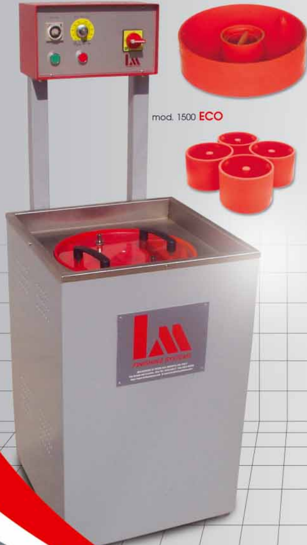
mod. 1500 ECO

NEW magnetic ECO tumbler with antiabrasive polyuretane tank.